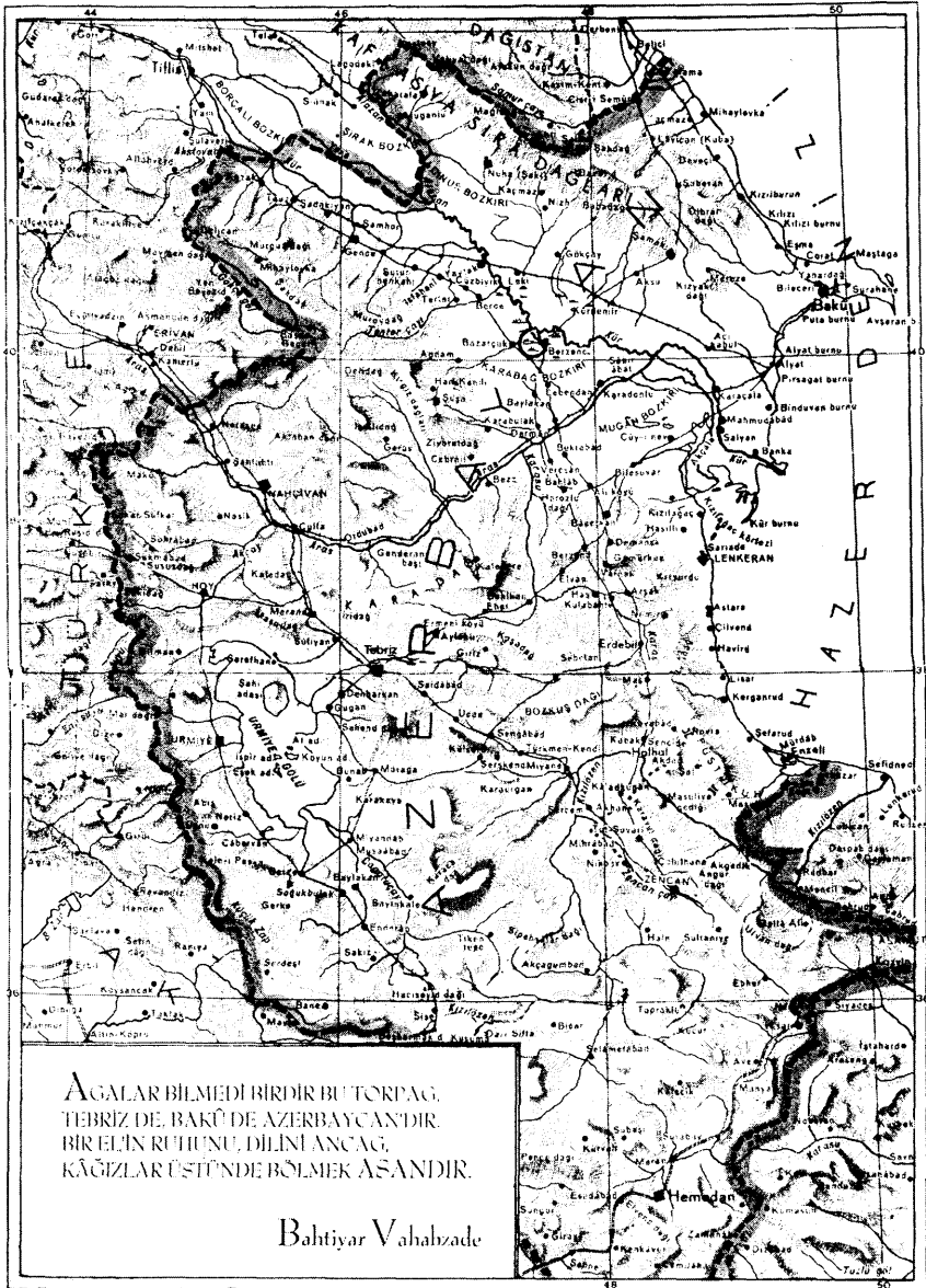
«نقشه آذربایجان متحد»